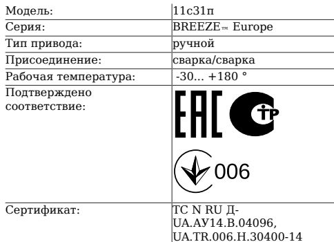
Таблица 1. Характеристики